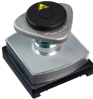
Mechanischer Spanner VCMC-S4-QUICK